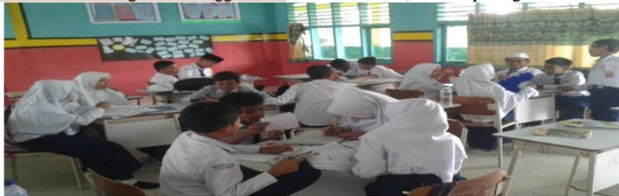
Gambar 3. Kondisi Kelas TS-TS

model TS-TS juga merupakan hal baru bagi kelas VII.2 di SMP Islam Al-Falah Jambi. Dalam pelaksanaan model pembelajaran TS-TS dua orang siswa tinggal di kelompok dan dua orang siswa bertamu ke kelompok lain. Dua orang yang tinggal bertugas memberikan informasi kepada tamu tentang hasil kelompoknya. Sedangkan yang bertamu bertugas mencatat hasil diskusi kelompok yang dikunjungi. Dalam pelaksanaan pembelajaran ini siswa kurang aktif dan hanya mengandalkan temannya yang memiliki kemampuan lebih tinggi. Hal ini membuat kegiatan pembelajaran kurang kondusif, terlihat pada gambar berikut: