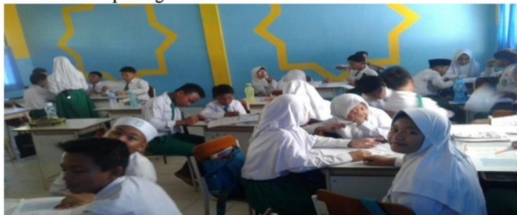
Gambar 1. Kondisi Kelas PBL

9 Dalam pelaksanaan pembelajaran PBL pada pelajaran matematika merupakan hal baru bagi kelas 9.II.1 di SMP Islam Al-Falah Jambi. Hal ini membuat suasana lain dari sebelumnya, karena siswa 9 terbiasa belajar secara konvensional. Kegiatan belajar dengan menggunakan PBL bagi siswa yang memiliki pengetahuan yang cukup luas membuat 20 kegiatan pembelajaran lebih efektif. Hal ini dapat dilihat pada gambar berikut: