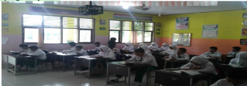
Gambar 5. Kondisi Kelas Konvensional

Dalam pelaksanaan model pembelajaran konvensional merupakan hal yang sudah biasa bagi kelas VII.4 di SMP Islam Al-Falah Jambi. Kegiatan pembelajaran di kelas VII.4 cukup 22 ndusif. Namun, siswa cenderung diam dan tidak mau bertanya jika mereka kurang mengerti pada soal yang diberikan oleh 55 guru. Kondisi kelas Konvensional dapat dilihat pada gambar berikut: